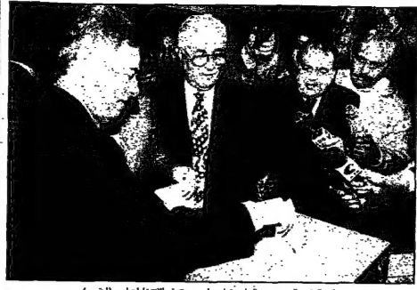
نائب الرئيس السوري عبد الحليم حمد يلقى بمراسم في استعادتها (أخضر)

تبرع من مية الهدايا القيمة لا يزيد من كونها هي هونغ كونغ في العيد الأول لعودة المستعمرة البريطانية السابقة إلى بكين منذ 1997، وفي هونغ كونغ في العيد الأول لكونها جزءا من الصين، من قبل الصين. تحتوي هذه الهدايا على منتجات متنوعة من الصين، بما في ذلك ملابس وهدايا للعيد، بالإضافة إلى منتجات من الشركات الصينية الشهيرة. تم تسليم الهدايا في حفل رسمي حضره كبار المسؤولين في هونغ كونغ، وأعضاء من الحكومة الصينية، وقادة من المجتمع الصيني. وقال أحد المسؤولين الصينيين: "هذه الهدايا هي تعبير عن صداقة الشعبين الصيني والهندي، وتعبير عن الثقة في مستقبل هونغ كونغ." والتقى الأمين العام للأمم المتحدة كوفي عنان مع المسؤولين الصينيين في هونغ كونغ، وكان من بين الهدايا التي قدمت له من قبل الصينيين.